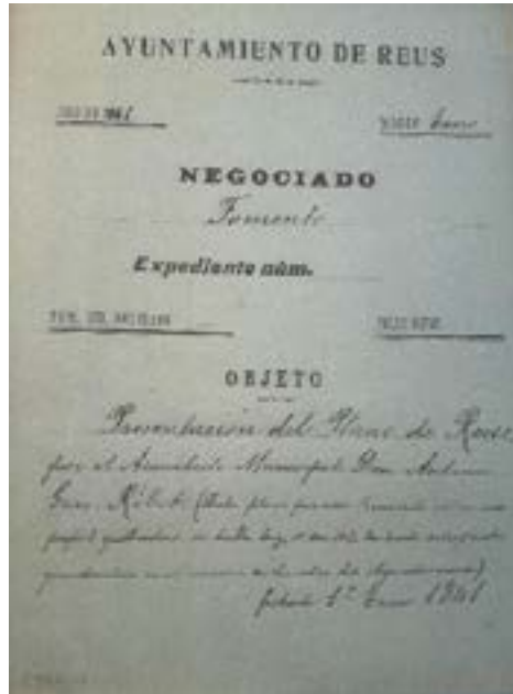
Figura 5. Portada del document Presentación del Plano de Reus [de 1858] por el Arquitecto Municipal don Antonio Gras Ribot

S'hi pot llegir que, tot i trobar-se en un estat de preservació precari, el 10 de desembre de 1907 es conservava a l'Ajuntament de Reus. En l'actualitat, aquest mapa es troba al despatx de l'alcalde i està en procés de restauració i digitalització.