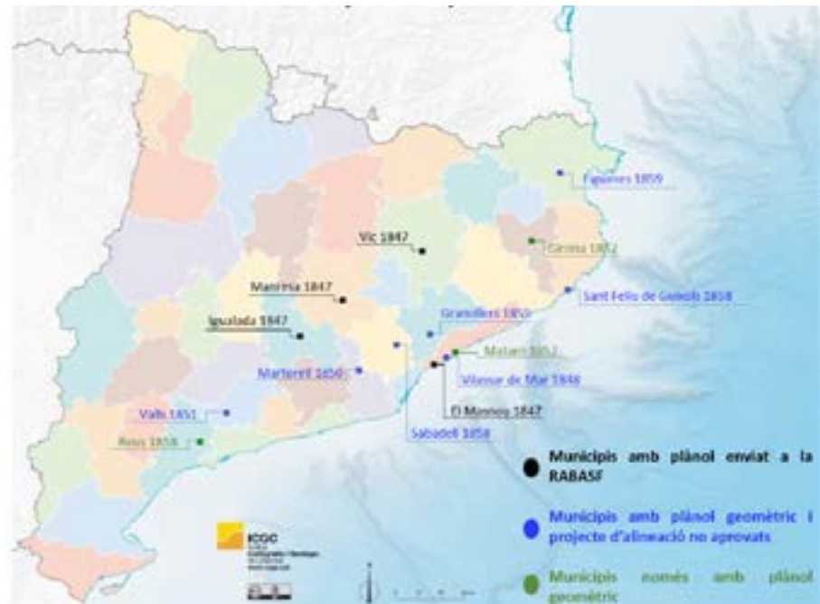
Figura 1. Mapa dels plànols geomètrics de poblacions de Catalunya (1846-1859)