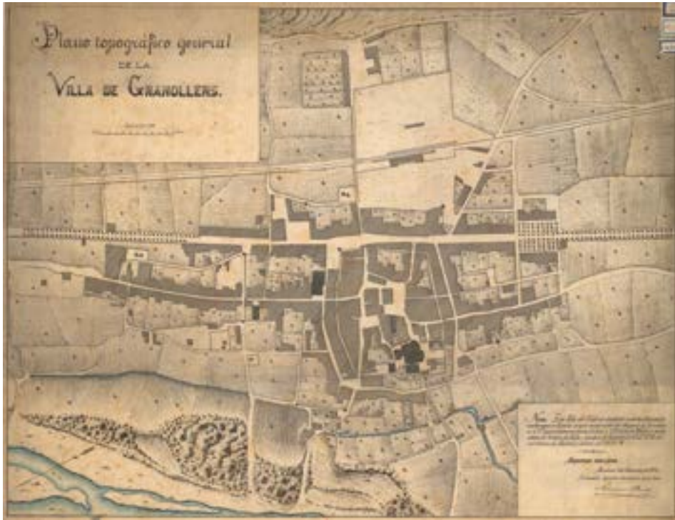
Figura 3. Plano topográfico general de la Villa de Granollers, Barcelona, 30 de novembre de 1874, escala 1:1.250

Aquest mapa és una còpia militar realitzada l'any 1874 del Plano iconogràfic general de la Villa de Granollers, aixecat el 1855 per Miquel Garriga i Roca. Aquesta còpia palesa que els plànols geomètrics de poblacions no foren utilitzats únicament amb finalitats urbanístiques.